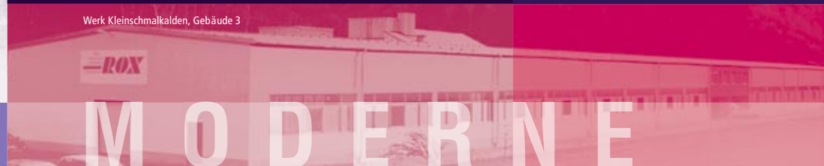
Werk Kleinschmalkalden, Gebäude 3