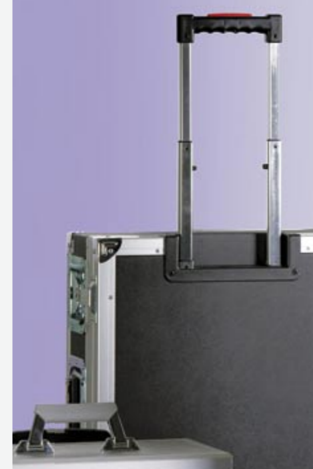
Freightainer®-Koffer mit Teleskopgriff Alu-Solid-Stand-Koffer

Als Systemanbieter bietet ROX ein umfassendes, logistisches Leistungsportfolio. Dazu zählen die komplette Bestückung des Koffers, einschließlich Beschaffung und Lagerung der entsprechenden Komponenten, sowie Just-in-time-Lieferung der Ware.